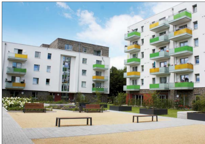
Attraktive Außenanlagen laden zum Verweilen ein

umfassende Unterstützung bis zum Bezug einer neuen Wohnung sichergestellt“, berichtet Gerd Höft Vorstandsvorsitzender der »Süderelbe« eG. Neun der ehemaligen Mieter haben einen weiteren Umzug mit Unterstützung der Baugenossenschaft auf sich genommen und sind an den alten Standort zurückgekehrt. Die Option, in den Neubau einzuziehen, stand allen ehemaligen Mietern offen.