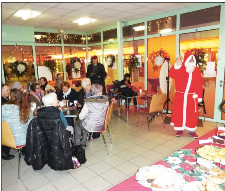
Das Stadtteilbüro wurde zum Adventscafé umfunktioniert

Wir danken allen Förderern und Spendern: Wegner Immobilien (Eigentümer der Rehrstieg Galleria) / SAGA GWG / Baugenossenschaft freier Gewerkschafter / HASPA Filiale Neuwiedenthal / REWE Markt Rehrstieg / BUDNI Drogeriemarkt Rehrstieg / Blumen Schmidt / Verein der Freiberufler und Gewerbetreibenden in der Galleria Rehrstieg e.V. / Firma Rainer Dammann Weihnachtsbäume / Bezirkliche Förderung des Bürgerschaftlichen Engagements / Verfügungsfonds Aktive Stadt- und Ortsteilzentren