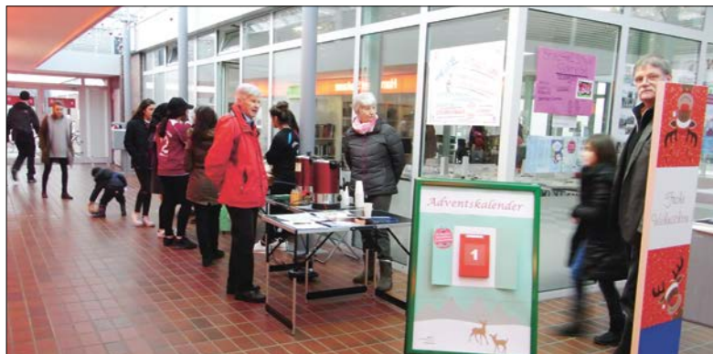
Der bewegliche Adventskalender vor dem Stadtteilbüro